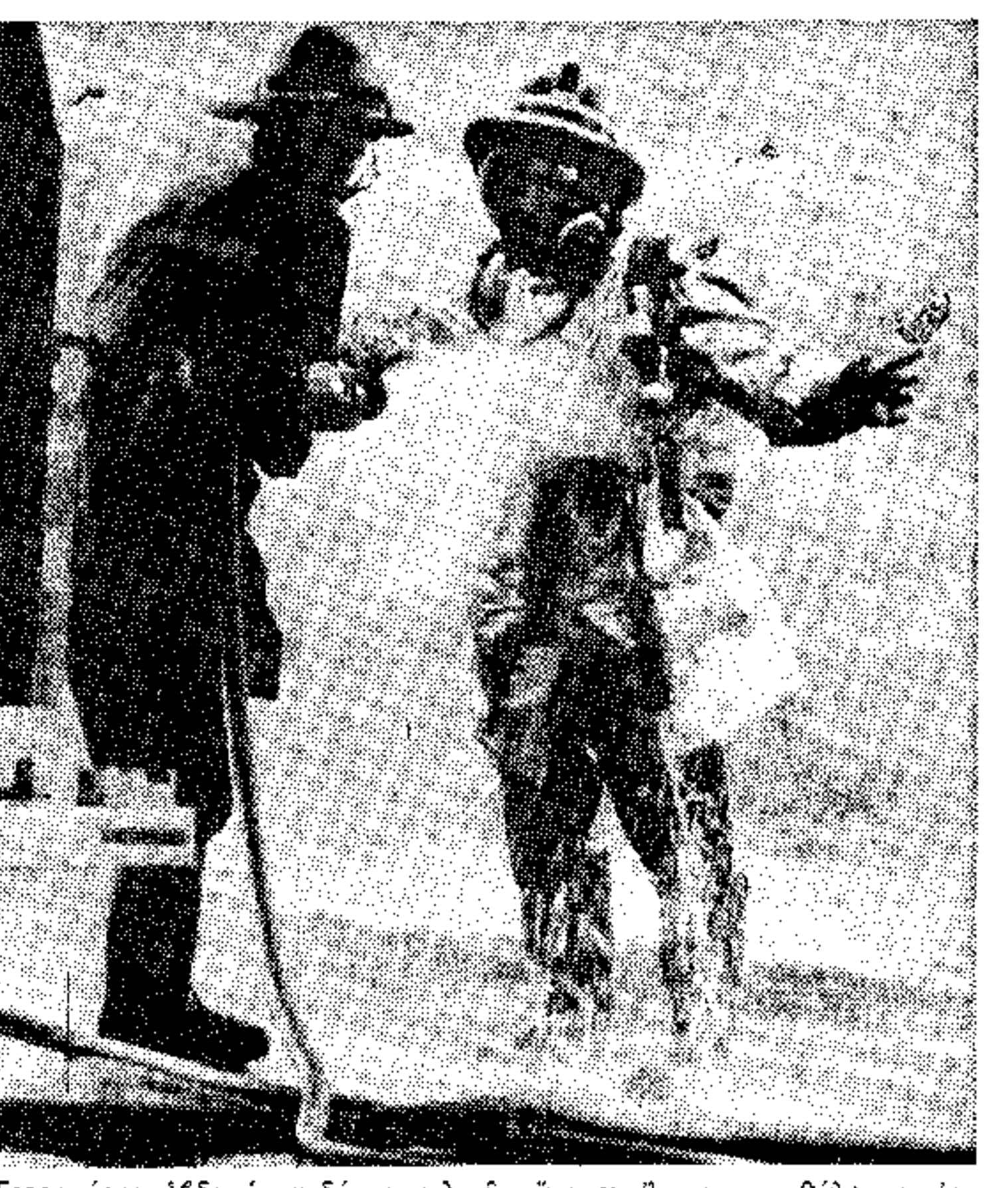
Τετρακόσια ἐβδόμηται δὴ συνολικῶς ὄμιον, ἔβλον περιβόητος...